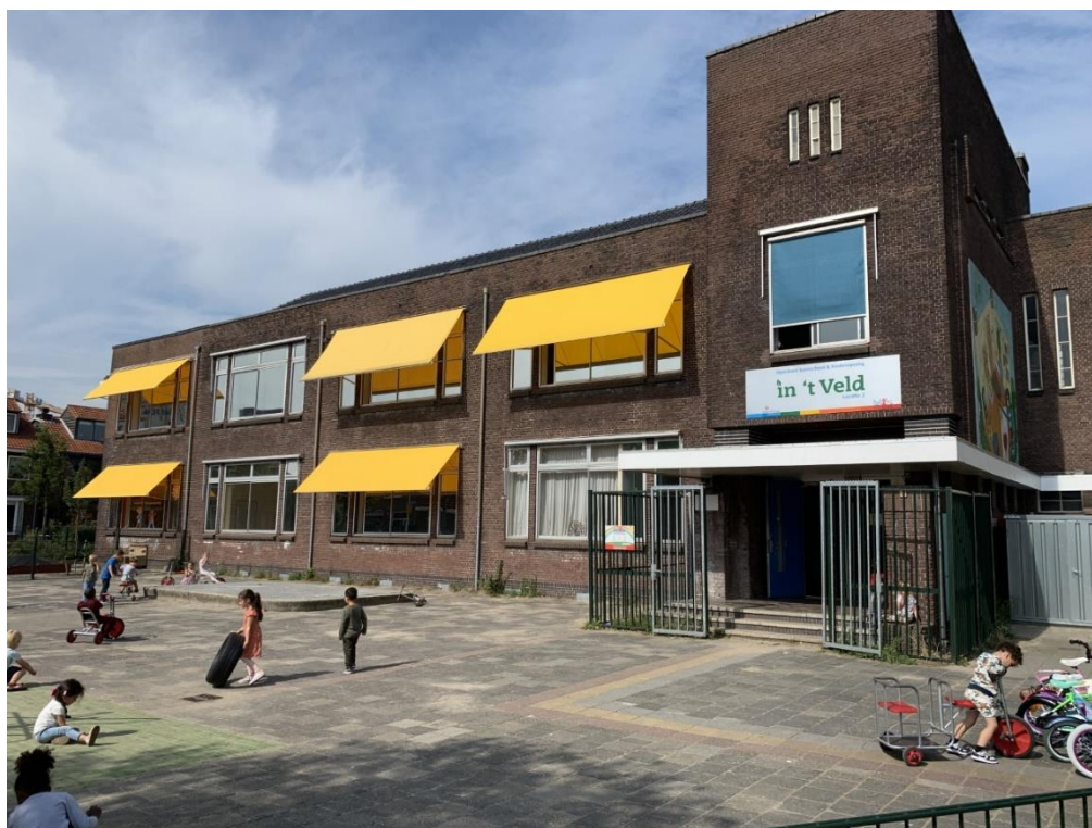
Kleuterplein van locatie 2 van OBS In 't Veld

OBS In 't Veld Rosmolenstraat 103 en 105 1506 HK Zaandam 075 6265533 info@obsintveld.nl